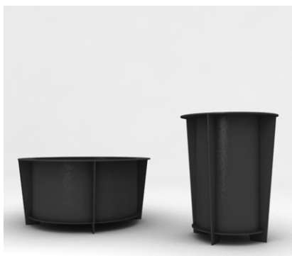
Gestell: RAL 7016 Behälter: RAL 7016

Folgende Standardfarben stehen zur Wahl: