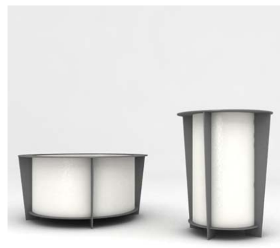
Gestell: RAL 7046 Behälter: RAL 9010