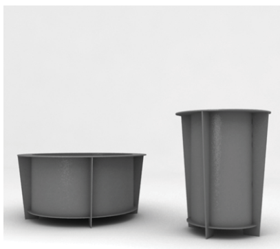
Gestell: RAL 7046 Behälter: RAL 7046