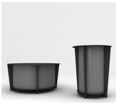
Gestell: RAL 7016 Behälter: RAL 7046