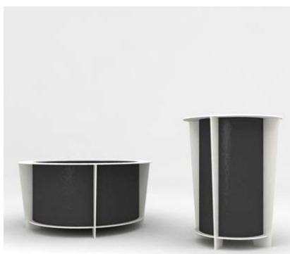
Gestell: RAL 9010 Behälter: RAL 7016