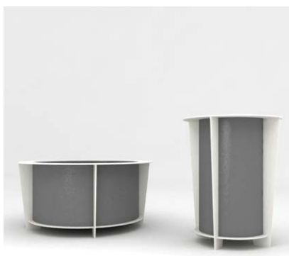
Gestell: RAL 9010 Behälter: RAL 7046