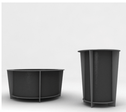
Gestell: RAL 7046 Behälter: RAL 7016