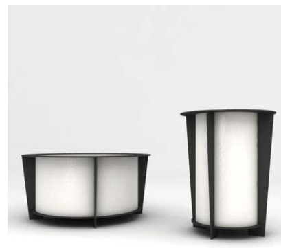
Gestell: RAL 7016 Behälter: RAL 9010