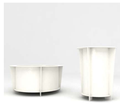
Gestell: RAL 9010 Behälter: RAL 9010